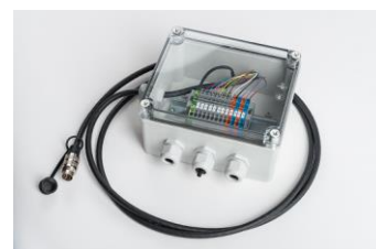
Moduł I/O Box