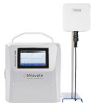
Moduł komunikacji bezprzewodowej BactoLink