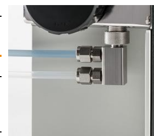
Moduł do pomiaru online