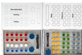
Zestaw czyszczący i walidacyjny

Kartridże wraz z usługą regeneracji, Moduł komunikacji bezprzewodowej BactoLink, Moduł zewnętrzny I/O, Zestawy czyszczące, Zestawy walidacyjne, Walizka transportowa, Pakiety rozszerzeń administracyjnych i naukowych.