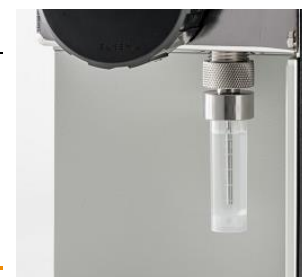
Moduł do pomiaru ręcznego